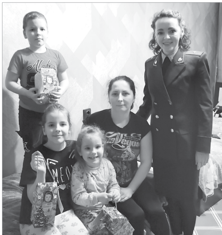
Сотрудники прокуратуры поздравили с новогодними праздниками многодетную семью и воспитанников Свирьстройского ресурсного центра и вручили им подарки

« НА ОСОБОМ КОНТРОЛЕ ПРОКУРАТУРЫ НАХОДЯТСЯ ОБРАЩЕНИЯ СОЦИАЛЬНО НЕЗАЩИЩЕННЫХ КАТЕГОРИЙ НАСЕЛЕНИЯ: ВЕТЕРАНОВ, ИНВАЛИДОВ, НЕСОВЕРШЕННОЛЕТНИХ, МНОГОДЕТНЫХ СЕМЕЙ И МАЛОИМУЩИХ ГРАЖДАН. »