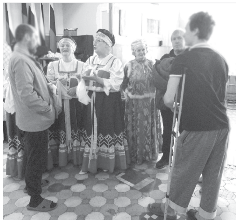
Общение с бойцами после выступления