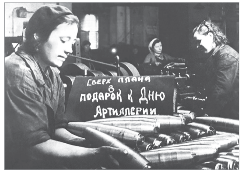
Женщины Ленинграда заменили своих мужей на заводах

Женщины послужили образцом стойкости и мужества для всех защитников города, ведь их участие в дни блокады было гораздо тяжелее, чем у мужчин. Они не только вели домашнее хозяйство, но и шли на работу, оставляя дома больных матерей и голодных детей. Они заменили на производстве мужчин. К примеру, на Невском машиностроительном заводе женщины составляли 80 процентов всех рабочих, а на Пролетарском паровозоремонтном – 79 процентов. На Кировский завод в 1942 году пришли работать 1800 женщин, главным образом бывших домохозяйек.