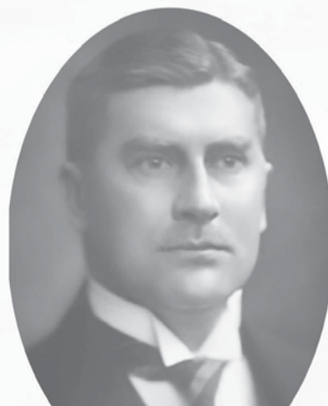
Аарно Юрьё-Коскинен, финский политический деятель и дипломат