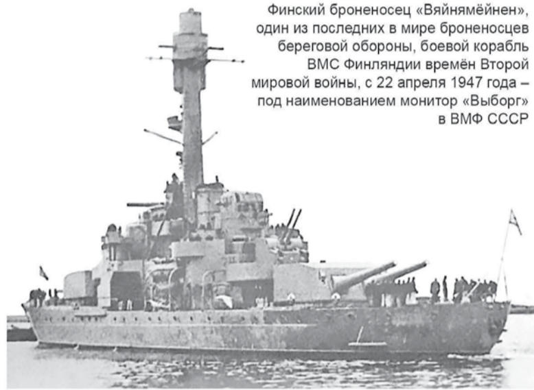
Финский броненосец «Вяйнямейнен», один из последних в мире броненосцев береговой обороны, боевой корабль ВМС Финляндии времён Второй мировой войны, с 22 апреля 1947 года – под наименованием монитор «Выборг» в ВМФ СССР

Кронштадта. ВВС КБФ производили разведывательное фотографирование северного побережья Финского залива и островов, а также западного побережья Ладожского озера.