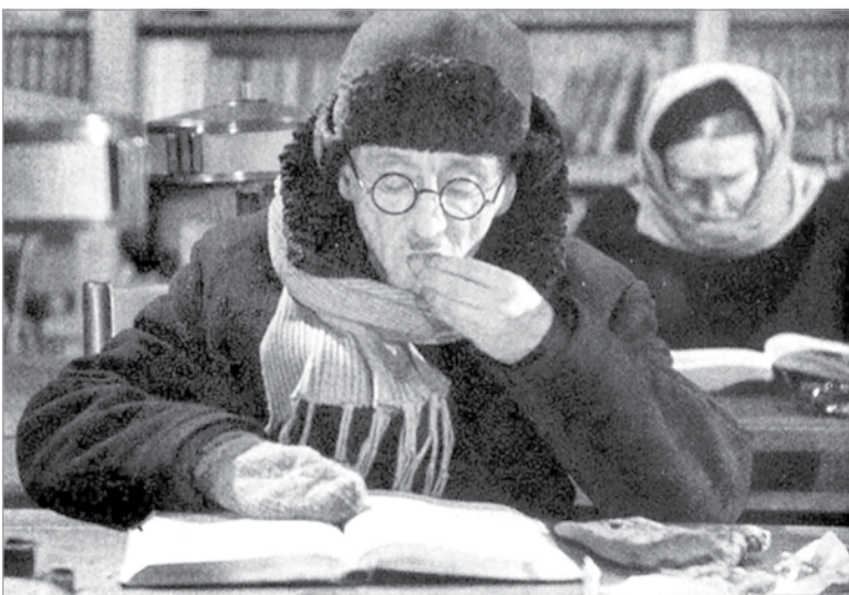
Публичные библиотеки в городе помогли ленинградцам победить и холод, и голод

(Продолжение следует)