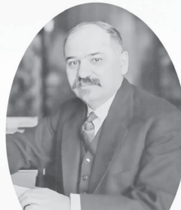
Иван Михайлович Майский, советский дипломат, историк, публицист. Полномочный представитель СССР в Финляндии