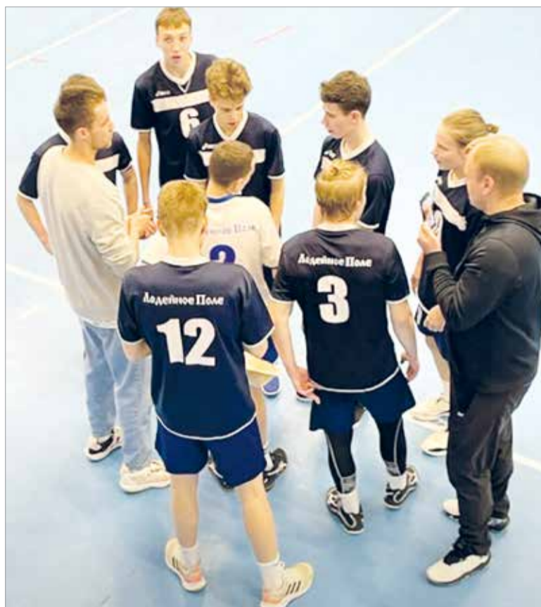
Тренеры настраивают наших ребят на игру