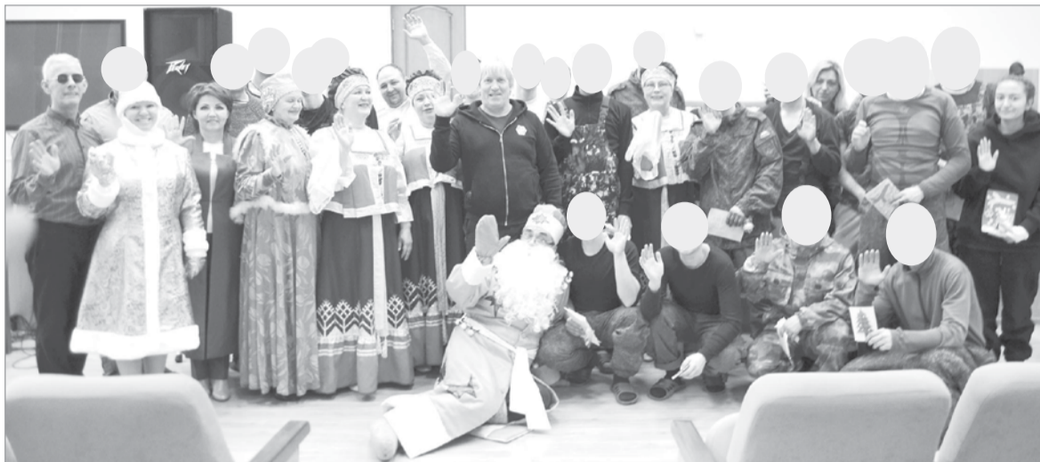
Члены агитбригады вместе с военнослужащими, проходящими лечение в госпитале