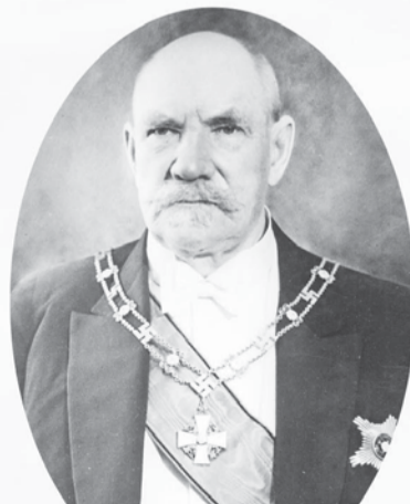
Пер Эвинд Свинхувуд, финский политический деятель, 3-й президент Финляндии